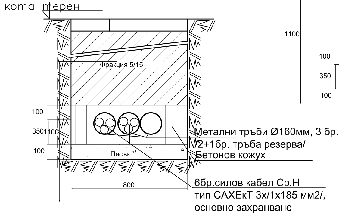
ИЗТЕГЛЯНЕ НА СИЛОВ КАБЕЛ Ср.Н ПРЕЗ Метална ТРЪБА ф160 В ИЗКОП 1.1/0.8 М ПРИ НАПРАВА НА КАНАЛНА МРЕЖА М/У Ш5 и Ш6 -разрез