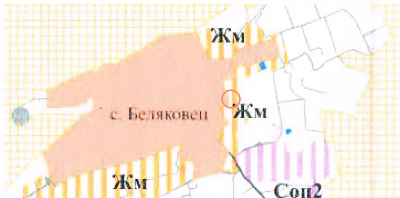
ИЗВАДКА ОТ ОБЩ УСТРОЙСТВЕН ПЛАН НА ОБЩИНА ВЕЛИКО ТЪРНОВО